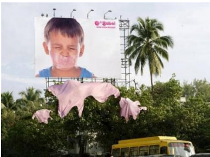
Outdoorová reklama na žvikačky