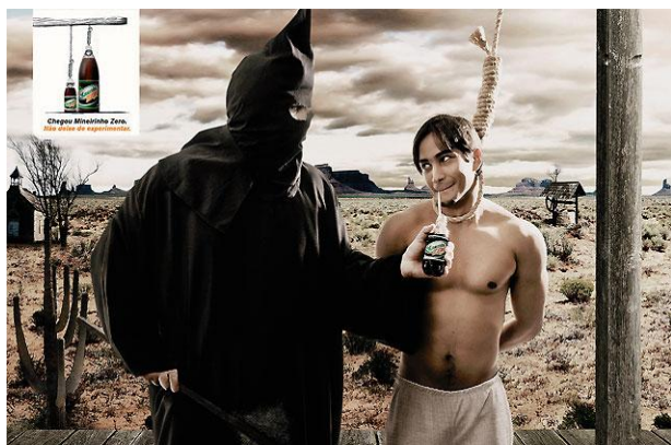
Mineirinho Zero - (limonáda) - poslední přání