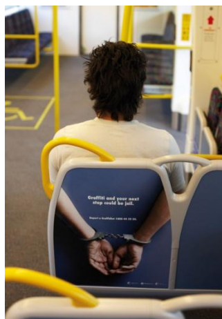
Reklama – upoznění, že skončíme za mřížemi, pokud budeme malovat grafit v MHD