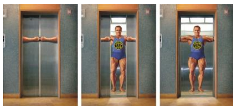
Reklama na dveřích výtahu