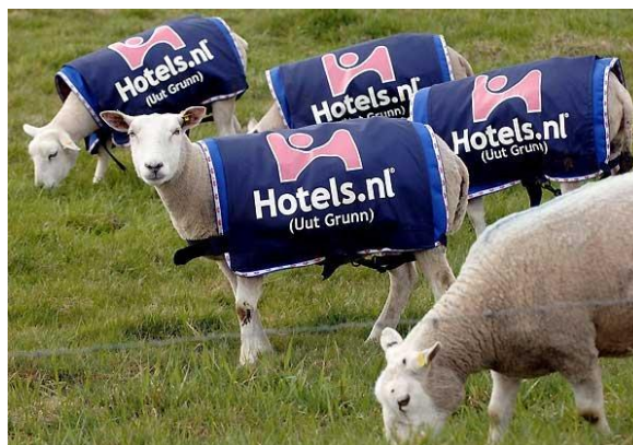
Reklama na ubytování - hotel